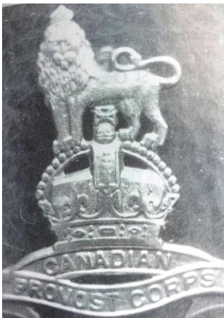
Insigne du Canadian Provost Corps