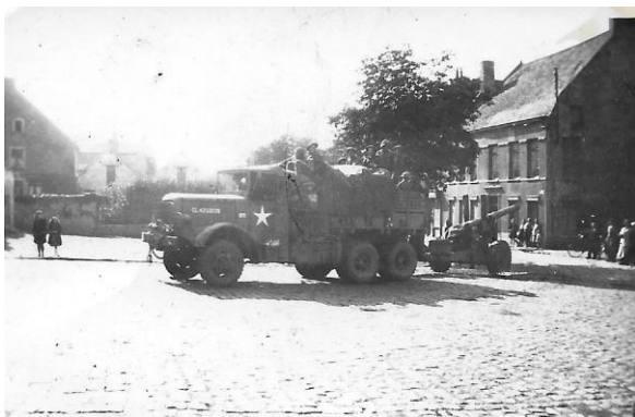
Camion canadien passant place de Watten