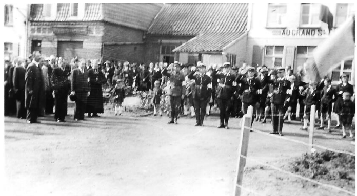
Devant le monument aux morts à l'issue du défilé du dimanche 10 septembre 1944