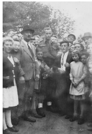
6 septembre 1944 vers 18h le lieutenant canadien du Canadian Provost Corps vient de rentrer dans Watten et pose en compagnie de wattenais