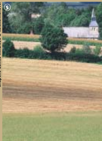
Chapelle Sainte-Mildrède à Volckerinchove.

d'ailleurs, la commune elle-même est divisée en une partie haute aux petites ondulations et une partie basse inondable, parfaitement plate. Etymologiquement, Millam proviendrait de « Middel » signifiant milieu et « Ham », une langue de terres qui domine les contrées marécageuses voisines. L'existence de terres inondables est l'une des explications de la venue de Sainte Mildrède dans la région peu avant l'an 700. La chapelle qui lui est dédiée, a été restaurée en 1702 et est un haut lieu de pèlerinage dans la région. Elle est nichée au fond d'un vallon et a conservé une part de mystère, qui se dévoile uniquement sur rendez-vous.