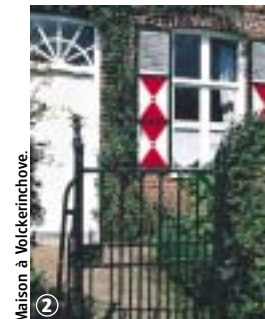
Maison à Volckerinchove.

Circuit, au patrimoine varié, praticable toute l'année. Le circuit court s'adresse plus particulièrement aux familles. Il ne passe pas à la chapelle Sainte-Mildrède mais un aller-retour de 1500 m permet d'admirer l'édifice. En période de pluie, prévoir de porter des chaussures étanches.