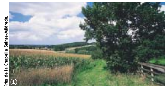
Près de la Chapelle Sainte-Mildrède.