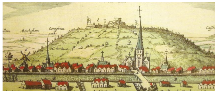
Le mont de Watten et son fort (esquisse du XVII e siècle)

de démolition en juin 1646, qui ne sera pas appliqué en totalité : seul le canon sera déplacé à Calais. En 1647, Watten retombe aux mains des Espagnols qui eux détruisent les fortifications en 1650. La position sera réoccupée plus tard par Turenne en 1657, par le gouverneur d'Artois en 1676, et par les Français en 1677. Les fortifications en terre bénéficient d'une « remise à neuf ». En 1678, Watten devient définitivement française.