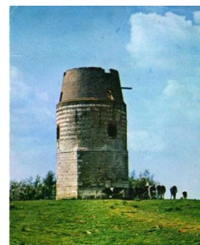
Le moulin avec l'observatoire (éd. Combier)