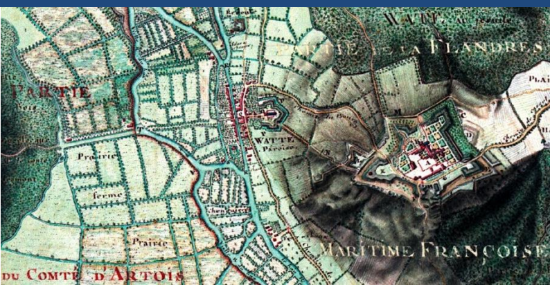
Le village de Watten avec ses fortifications (Plan de C. Masse, 1728)