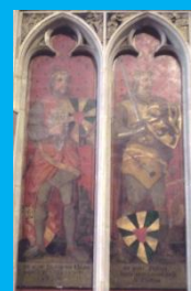
Thierry d'Alsace et Philippe d'Alsace, comtes de Flandre au XIIe et XIIIe siècle (chapelle des comtes de Flandre, Courtrai)