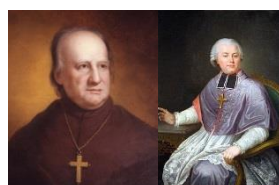
De 1753 à 1755, John Carroll (à gauche) fit son noviciat à Watten, et deviendra le premier évêque catholique des Etats-Unis. Monseigneur de Puysegur (à droite), évêque de Saint-Omer de 1775 à 1778 dont dépendait Watten jusqu'à la Révolution.

Les bâtiments qui subsistaient furent vendus comme biens nationaux sous le nom de « château » en 1792. Les nouveaux acquéreurs voulurent, après la Révolution, démolir la tour de l'abbaye, mais défense leur en fut faite par l'autorité administrative. Acquis par le gouvernement en 1822, en même temps que le terrain qui la supporte, cette tour servait, dit-on, de point de repère aux navigateurs.